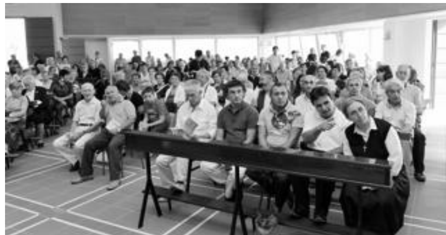
La comunità di fedeli che è arrivata per la consacrazione della chiesa del Sacro Cuore di Robadello

arrivati al traguardo. Ci siamo arrivati dopo un lungo cammino e anche non poche fatiche, ma abbiamo confidato nella Provvidenza che viene dall'alto». Solenni sono stati quindi i riti di consacrazione, la benedizione dell'acqua e aspersione, la dedicazione e le unzioni, sia dell'altare che delle dodici croci lungo il perimetro della chiesa (simbolo degli apostoli). L'incenso ha inoltre riempito i locali e si sono accesi ceri e luci. Tutto questo mentre gli occhi dei fedeli sono