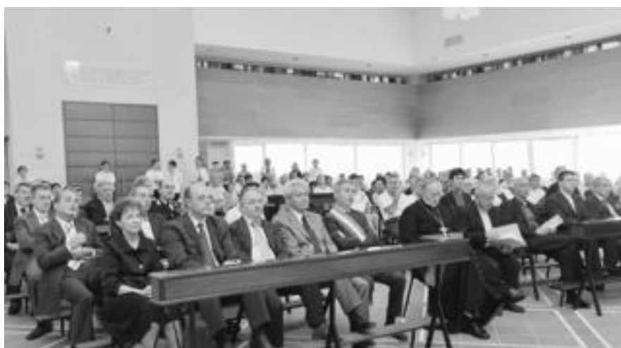
Autorità e gente comune all'interno della chiesa del Sacro Cuore, durante la presentazione di ieri

Un intervento che è partito nel maggio del 2008, dopo che era stato indetto un bando per un concorso d'idee, in collaborazione con l'ordine degli architetti della provincia di Lodi. Una selezione vinta dal progetto presentato dall'architetto Cesare Senza-